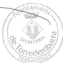
Rafael Orihuel Iranzo