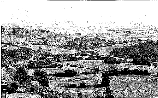
El paisatge de l'Alta Segarra, des del nucli de Segur (Veciana)

El Partit Demòcrata inscriu la reivindicació de la nova comarca amb la voluntat d'afrontar un debat per elaborar "un model territorial de Catalunya en el