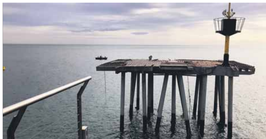
El pont del Petroler va quedar partit i ara es retiren les restes de la plataforma final ■ A.B.

nord-americà, contra la sentència. En el procés inicial, una consumidora va demanar que es declarés la nul·litat del contracte de targeta de crèdit per l'existència d'usura en el tipus d'interès fixat. L'entitat financera li va respondre que els tipus d'interès pactats no eren notablement superiors als habituals en el mercat d'aquestes targetes, segons els tipus d'interès del Banc d'Espanya. ■ REDACCIÓ