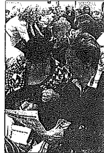
El públic del casal del Centre, ahir.

Un euro diari. O el que és el mateix: 365 euros a l'any. És l'ajut que l'Ajuntament de Gavà donarà als ciutadans majors de 65 anys que destinin part de la pensió a ajudar els fills i nés víctimes de l'atur de llarga durada. Es tracta d'una iniciativa batejada com a Jubilació 365 , amb què el consistori vol ajudar els gavanencs que, tot i no estar en situació de pobresa extrema, sí que viuen una situació familiar complicada. A partir del 9 de maig, podran demanar aquest ajut les persones majors de 65 anys que tinguin fills