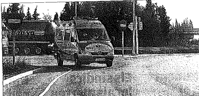
Una ambulància duent a terme un servei a les Terres de l'Ebre

Segons han confirmat fonts de la plataforma, encara no hi ha comunicació oficial de la data exacta en què es produiran els canvis, però tot fa pensar que