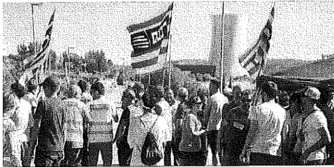
Personal extern de les nuclears, ahir, a les portes del complex d'Ascó.

Condicions fixes que assegurin els llocs de treball, respectin els convenis sectorials i tinguin en compte la subrogació individual o drets com la percepció del plus per recàrrega. Són algunes de les demandes que els treballadors de les centrals nuclears catalanes van reclamar ahir a les portes dels complexos d'Ascó i Vandellòs, en la primera jornada de vaga del personal de les empreses subcontractades.