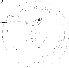
Rubén Otero Viñals