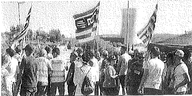
Personal extern de les nuclears, ahir, a les portes del complex d'Ascó

Condicionis fixes que assegurin els floes de treball, respectin els convenis sectorials i tinguin en compte la subrogació individual o drets com la percepció del plus per recàrrega. Són algunes de les demandes que els treballadors de les centrals nuclears catalanes van reclamar ahir a les portes dels complexos d'Ascó i Vandellòs, en la primera jornada de vaga del personal de les empreses subcontractades.