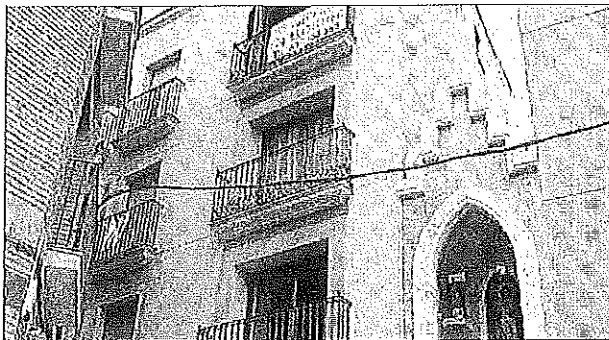
Un pis de lloguer a tocar de la plaça del Teatre, al nucli antic de Reus.