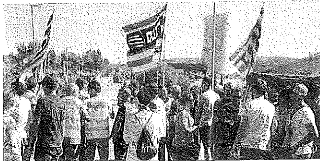
Personal extern de les nuclears, ahir, a les portes del complex d'Ascó.

Condicionis fixes que assegurin els floes de treball, respectin els convenis sectorials i tinguin en compte la subrogació individual o dreus com la percepció del plus per recàrrega. Són algunes de les demandes que els treballadors de les centrals nuclears catalanes van reclamar ahir a les portes dels complexos d'Ascó i Vandellòs, en la primera jornada de vaga del personal de les empreses subcontractades.