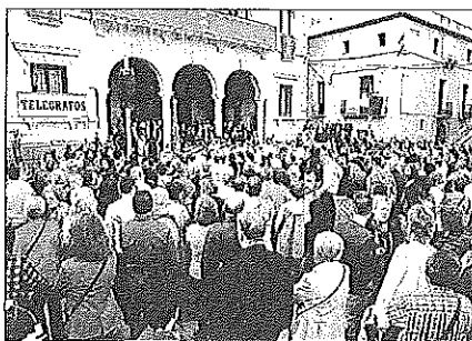
La celebració ha omplert els carrers d'Amposta i ha fet revivir el passat més immediat del Montsià