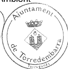
Elisenda Forés Planells